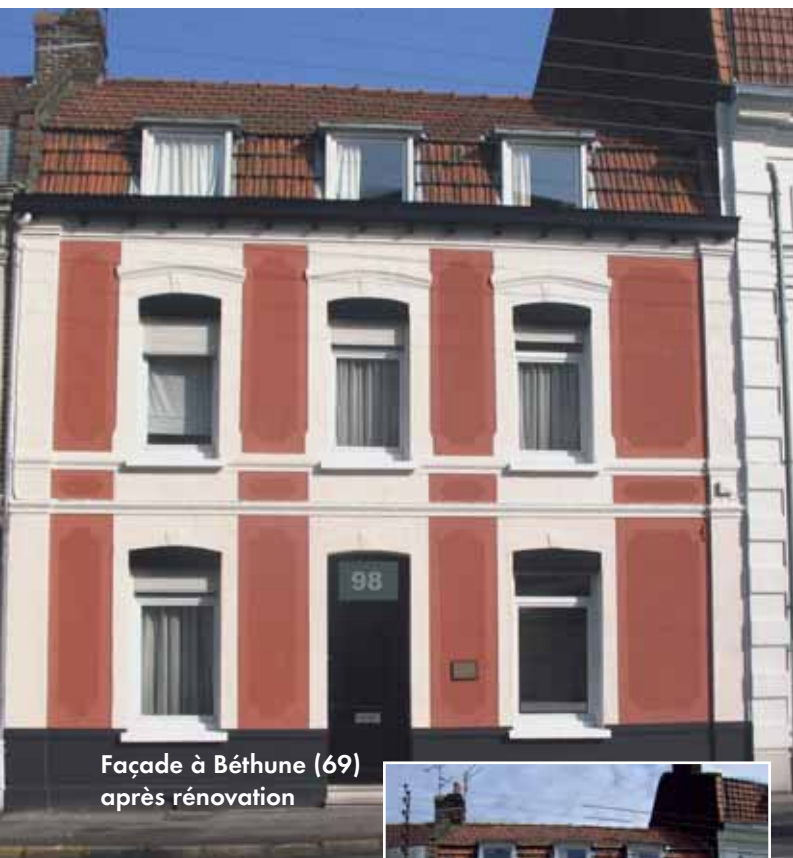
Façade à Béthune (69) après rénovation